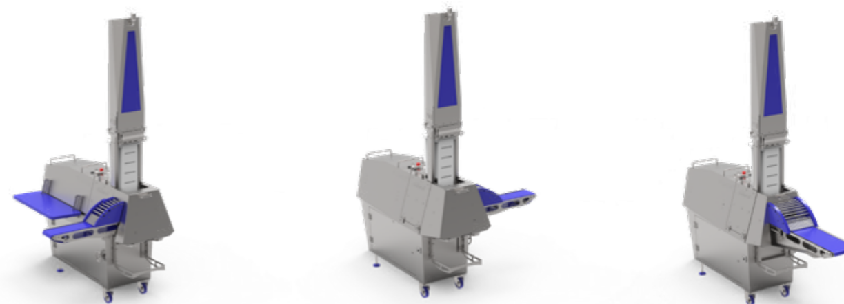
Três opções de configuração da transportadora de saída

alinhar porções e criar porções sobrepostas para o empacotamento direto em bandejas. A V-Cut 160 pode produzir – sem crosta de congelamento – produtos individuais, pilhas e cubos de peso fixo.